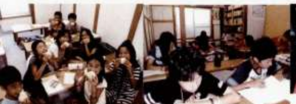
小学生に豚まんを差し入れ ある時!...笑顔!!

私立中学受験教室のとび級Bは、2年計画でレベルの高い中学校の入学試験を目指すための教室です。第1目標は灘・東大寺・西大和・四天王寺英数Ⅱ・星光であり、少なくとも第2目標の清風理Ⅲ・四天王寺英数Ⅰ・奈良学園・奈良カレッジ等に合格できる学習をします。大手受験塾と比べ、費用も学習時間も3分の1くらいですが、学習内容は大手受験塾のトップレベルと同じですので、誰にでもできる学習ではありません。ただ、子供らしさを失わせることがないように、また合格そのものが目標ではなく合格したその中学校で真剣に勉強することが目標になるような、指導を心掛けています。