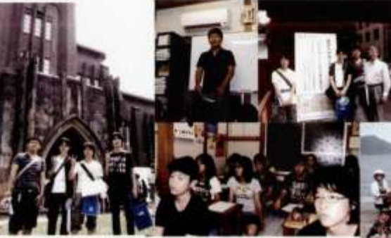
東大オープンキャンパス引率・卒業生のガイド付き その報告を熱心に聞く後輩塾生たち