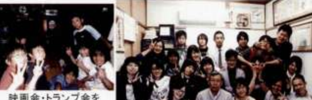
映画会・トランプ会をよくします ボウリングセンター ボーリング・食事にも出かけます