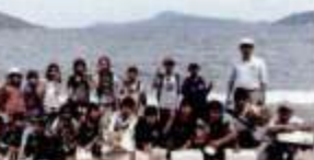
昨年も潮干狩りに行きました