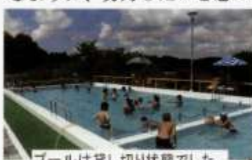
プールは貸し切り状態でした。

授業の途中で『おやつタイム』があったり、映画を見たり、トランプをやったり、食事をしたり楽しい工夫を凝らしながら勉強に励んでいます。卒業してから、教え子や保護者の 心に残る教室 になるように、努力したいと思っています。