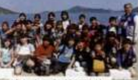
楽しかった満天狩り！