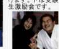
食事にもよく出かれます。下は受験生激励会です。