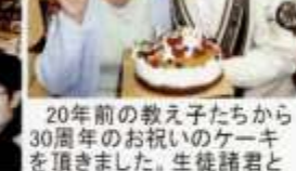
20年前の教え子たちから30周年のお祝いのケーキを頂きました。生徒諸君と一緒に楽しく頂きました。