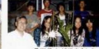
月下美人が咲きました。