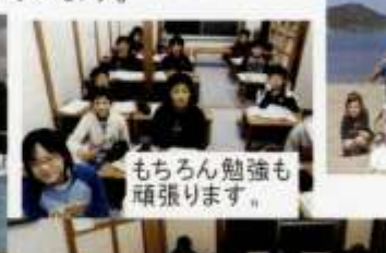
もちろん勉強も頑張ります。