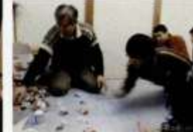
小学生恒例輪投げ大会！約はお菓子です。